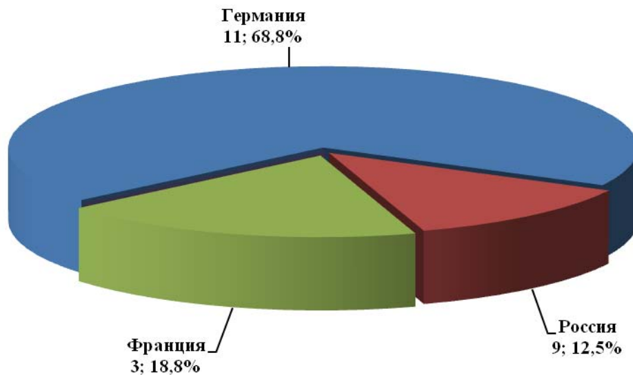
Распределение долей рынка новых подводных лодок в 2010-2013 гг.