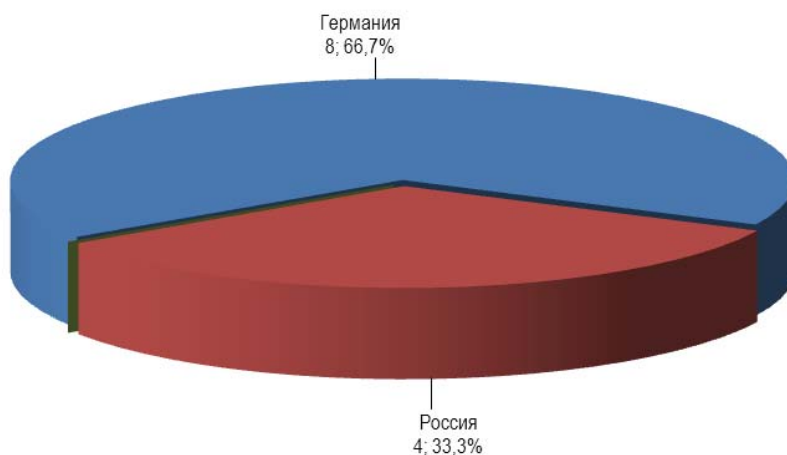
Сводная таблица по поставкам подводных лодок в 2007-2014 гг.